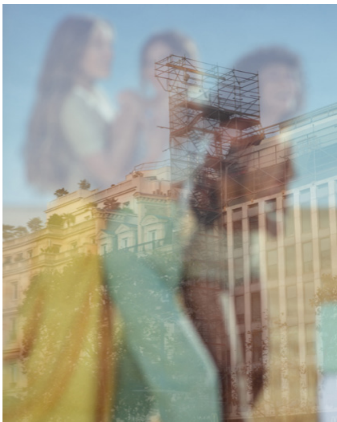
Fashion Advertisement, Champs-Élysées, Paris [Anunci de moda, Camps Elisis, París], 2021