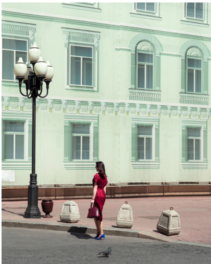
Arbat, Moscow [Carrer Arbat, Moscú], 2021

Brussel·les, Tòquio, Madrid i Barcelona gràcies al KBr Photo Award. L'autora recorre les ciutats i fotografia edificis en construcció que conviuen amb imatges de marques de moda, bellesa, propaganda de bancs, d'immobiliàries, etc., que proliferen a les façanes, les tanques, els autobusos i altres suports publicitaris urbans. Són anuncis sovint monumentals que es poden trobar a totes les grans ciutats i que a poc a poc els fan perdre la seva individualitat per anar-les transformant en una de sola, d'unificada.