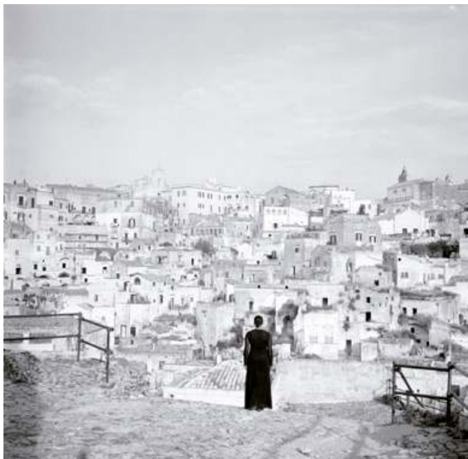
La vora del temps. Antiga Roma de la sèrie Vagarejant, 2006