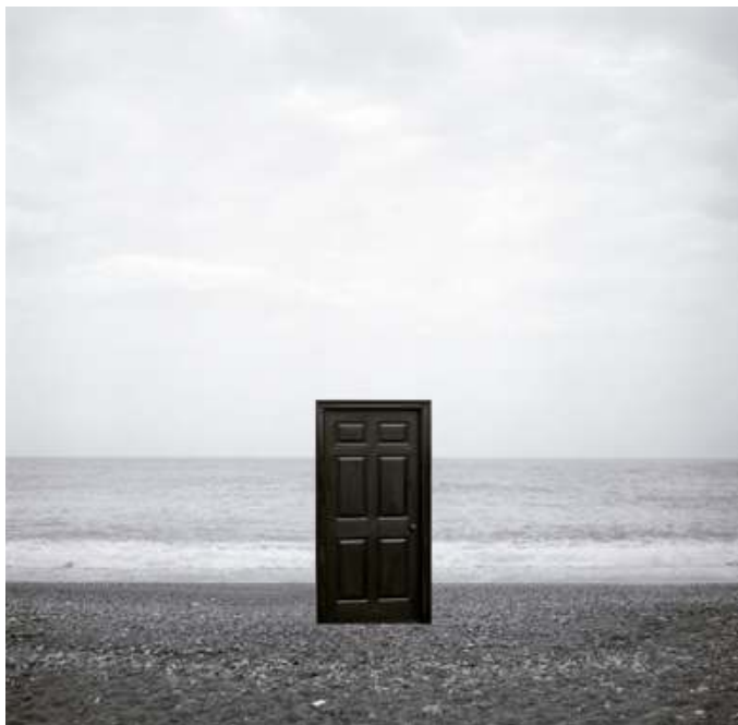
Que tanca, la porta? , 2019

Des que va iniciar la seva trajectòria a principis del 1980, l'artista Carrie Mae Weems (Portland, Oregon, 1953) ha dedicat el seu treball tant a reformular la identitat de la comunitat afroamericana i de les dones, com també a explorar els mecanismes que s'amaguen rere el poder, qui l'exerceix i sobre qui s'exerceix. Les seves obres, tot i centrarse en la fotografia, excedeixen els límits d'aquest mitjà amb disciplines com la performance, el vídeo o la instal·lació, i estan impregnades d'un sentit de lluita contra la injustícia i la violència amb l'esperança de millorar aquest món.