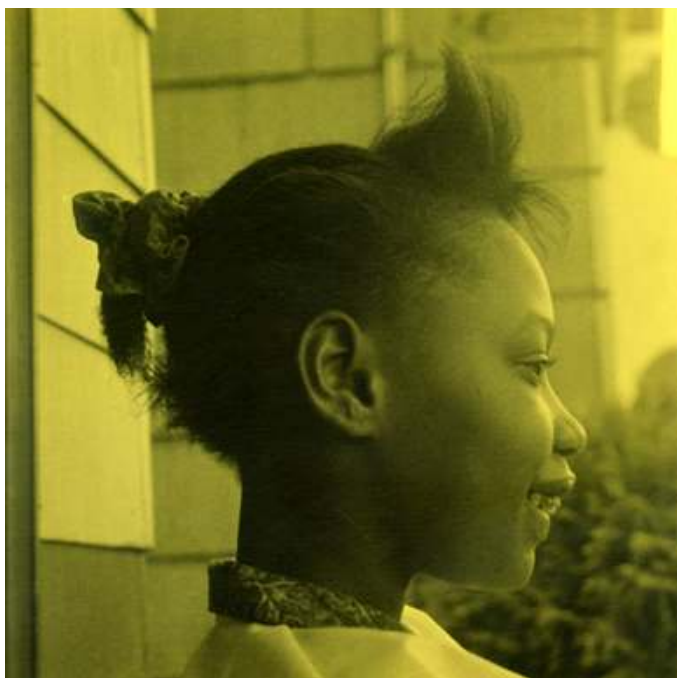
Nena groga daurada de la sèrie Sense títol (Gent de color), 2019