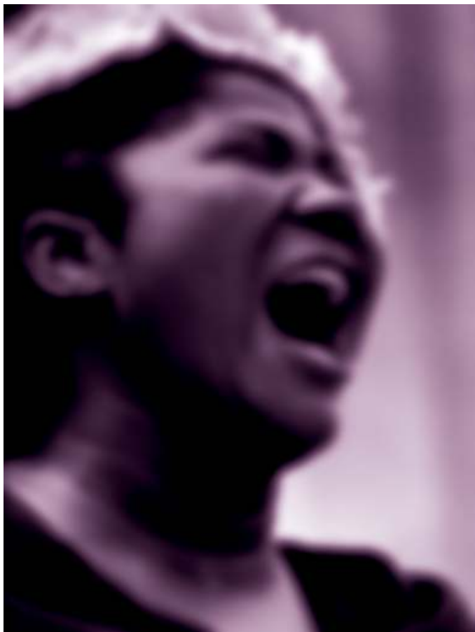
Mahalia de la sèrie L'impuls, la crida, el crit, el somni , 2010

of the Arts; l'any 2013 va rebre una beca de recerca MacArthur; i, el setembre del 2015, el Hutchins Center for African & African American Research va concedir-li la W. E. B. Du Bois Medal.