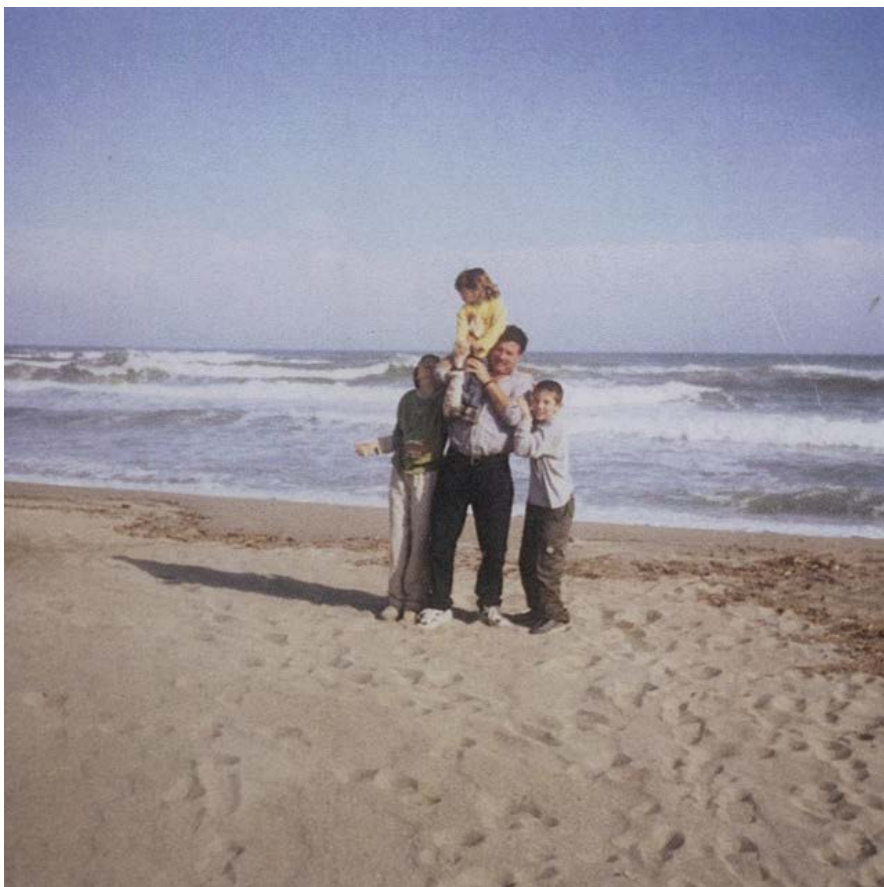
NANOUC CONGOST, sèrie “papa”, 2021

El projecte “ papa ”, de Nanouch Congost, sorgeix arran de la cerca interior de la seva pròpia identitat. Després de reconèixer la influència que ha tingut la relació amb el seu pare en el desenvolupament de la seva personalitat, comença a analitzar quina és la realitat d’aquesta relació i què representa en el nostre comportament aquesta influència tan directa, encara que es tracti d’un pare absent, com en aquest cas. El projecte consta d’una sèrie d’entrevistes en les quals Nanouch Congost demanava exactament el mateix a cada un dels participants: una fotografia d’arxiu del seu pare i que en fessin una descripció completament lliure. Finalment, els feia un retrat. Per fer la fotografia, els demanava que tanquessin els ulls i que pensessin en moments específics de la seva infantesa i de l’actualitat amb el seu pare; després els preguntava com se sentirien si els digués que són clavats al seu pare i, en el moment que obrien els ulls, els fotografiava.