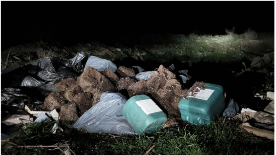
GUILLERMO FERNÁNDEZ, serie Los santos inocentes , 2019 © Guillermo Fernández

Los santos inocentes es un relato fotográfico de la provincia de Granada en la actualidad, un territorio que vuelve a ser “reino”: el reino de la marihuana. Guillermo Fernández explora el paso de la noche al día en una zona rural deprimida próxima a la ciudad y revela la actividad a la que se ve obligada a dedicarse la “generación perdida” tras la crisis económica de 2008 y el inmediato estallido de la burbuja inmobiliaria. Con este proyecto, Guillermo Fernández busca las similitudes entre pasado y presente, entre la época que retrata Miguel Delibes en Los santos inocentes (1981) y la actual, entre el sistema impuesto por aquellos caciques y el que actualmente autoimpone a miles de jóvenes la aceptación de que no hay futuro para ellos. El autor nos lleva por una serie de paisajes nocturnos de antiguos olivares, caminos rurales y cortijos típicos alumbrados por una luz artificial que marca el camino a seguir y sirve de nexo de unión entre los diferentes escenarios planteados. La trama culmina con el amanecer, cuando la luz natural sustituye a la artificial y “alumbra” la realidad escondida tras la noche.