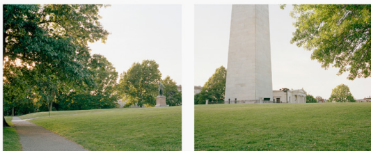
Baker Hill, 17 de junio de 1775.