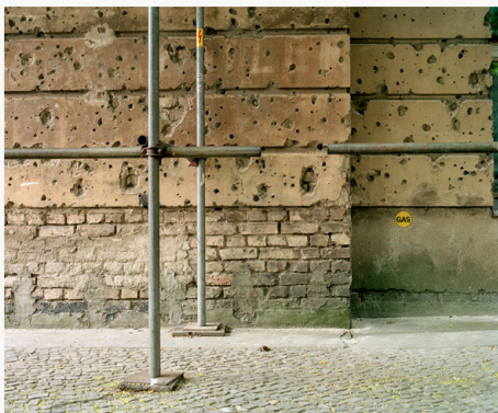
Größe Hamburger Straße Scheunenviertel